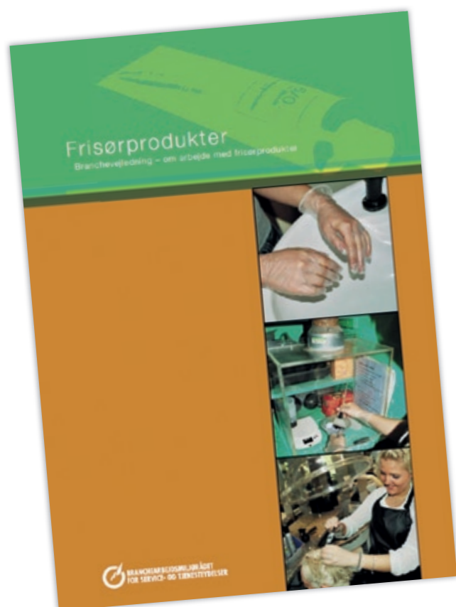
Sådan ser Branchevejledningen om arbejde med frisørprodukter ud. Den kan downloades på www.bar-service.dk

Alle frisørsaloner skal lave en skriftlig arbejdspladsvurdering – en APV – der kan skabe overblik over arbejdsmiljøforholdene i salonen, og som kan danne grundlag for bl.a. iværksættelse af forebyggende initiativer.